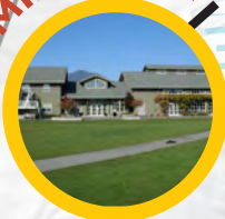
Mill Valley Community Center