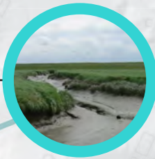
Tidal channel - Canal de marea