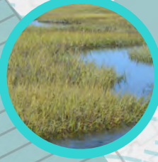
Low marsh - Pantano bajo