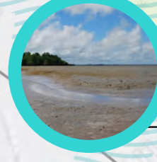
Mud flat - Marisima Tamalpais High