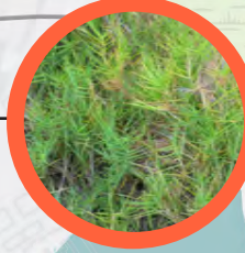
Salt grass - hierba salada ( Distichlis spicata )