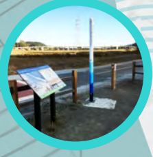
Sea Level Rise Exhibit - Exposición del Aumento del Nivel del Mar