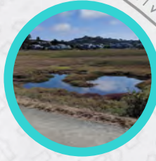
Salt pan - Área de agua salada