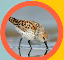
Western sandpiper - Lavandera occidental ( Calidris mauri )