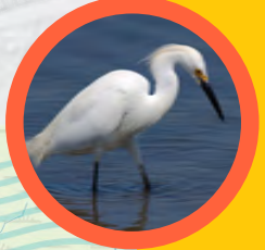
Snowy egret - Garceta blanca ( Egretta thula )